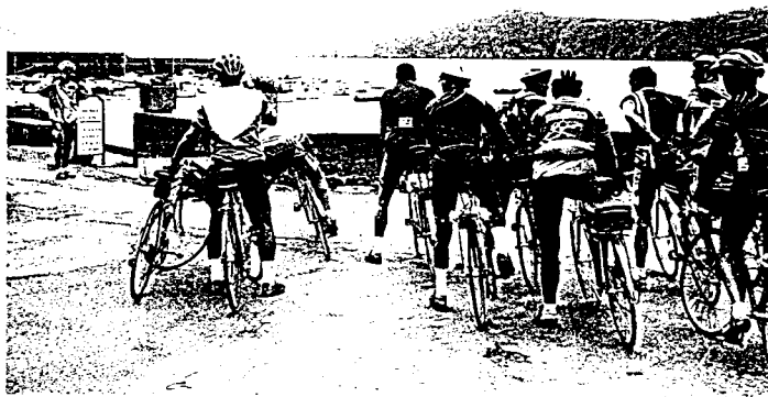
Sport et tourisme sont étroitement liés.